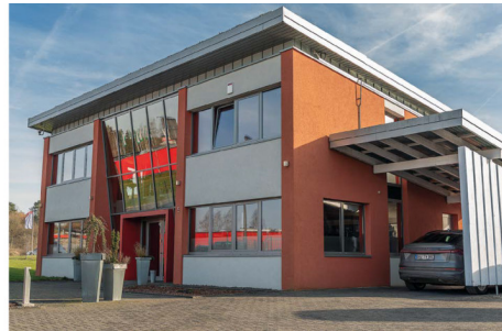
Oben: Das Firmengebäude in der Handwerkerstraße in Hillesheim.