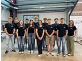
Die neuen Nachwuchskräfte (Namen unter "mehr")

Arzfeld/Üttfeld (red/boß) Mit zwölf neuen Auszubildenden und Dual Studierenden startet die Zahnen Technik GmbH in das Ausbildungsjahr 2026. Die Berufseinsteigerinnen und Berufseinsteiger beginnen ihre Laufbahn in technischen und kaufmännischen Ausbildungsberufen sowie in Dualen Studiengängen. Mit einer Ausbildungsquote von rund 25 Prozent gehört das Unternehmen aus Arzfeld (Eifelkreis) seit vielen Jahren zu den ausbildungstärksten Betrieben der Wasser- und Abwasserbranche. Als Spezialist für Anlagenbau, Automatisierung und digitale Lösungen in der Wasser- und Abwasserbehandlung plant und realisiert Zahnen Technik Projekte für kommunale und industrielle Kunden.