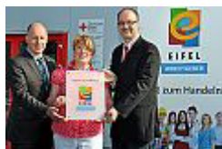
DRK Kreisverband Euskirchen