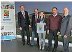
Die Kommunalen Netze Eifel