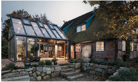
Seit 2017 ist die Firma Kalverkamp Mitglied der JOLEKA-Familie. Hier werden vor allem Wintergärten und Terrassendächer gefertigt.

Heute konzentriert sich das Unternehmen auf einen Umkreis von rund 200 Kilometern, in dem man hauptsächlich tätig ist. Da gehören dann Rheinland-Pfalz, Nordrhein-Westfalen, das Saarland sowie die europäischen Nachbarn Luxemburg und Niederlande dazu, wo JOLEKA Produkte verkauft und eingebaut werden. Bei JOLEKA steht der Privatkunde im Fokus, für den Objektbau ist Fensterbau Fischer aus Bitburg zuständig, dieses Unternehmen wurde in den 90iger Jahren übernommen. Und mit dem Wintergarten-Spezialisten Kalverkamp wurde zum 1. Juli 2017 ein weiteres