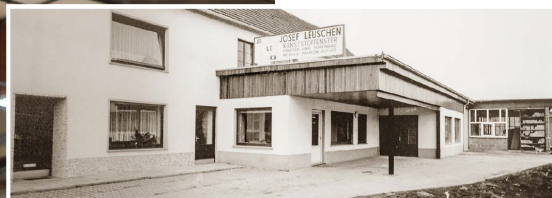
Das Firmengebäude in den Anfangszeitel: Das Unternehmen ist seit 50 Jahren in Kalenborn beheimatet.

Der Fenster- und Haustürenhersteller aus Kalenborn hat zwar schon 80 Jahre seit Gründung hinter sich, ist aber alles andere als verstaubt oder in der Vergangenheit verhaftet. Das Gegenteil ist der Fall: Jede Generation hat aufgebaut und weiter entwickelt.