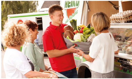
Die HEIKO-Fahrzeuge sorgen in 90 Prozent der angefahrenen Dörfer für die Grundversorgung, da es vor Ort keine Lebensmittelgeschäfte mehr gibt.