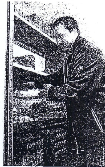
Damit die Eiersteigen nicht ins Rutschen geraten, sorgen seitliche Aufkantungen an den Regalen für Halt. Um Rührrei bei Bodenwellen zu vermeiden, hilft aber nur runter vom Gas.