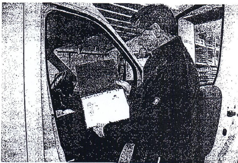
Ob Rückstände bei den Kunden, Sonderwünsche oder Straßensperrungen, die Fahrer sind angehalten, alle Besonderheiten rund um jede einzelne Tour schriftlich zu notieren.

Dort befindet sich auch der Kassenbereich mit der Verkaufsoffnung zum Kunden. Die Regale bieten Platz für bis zu 4300 Eier. Zum Abpacken braucht sich der Fahrer nur kurz umzudrehen und kann sich den Kunden wieder schnell zuwenden. Für die