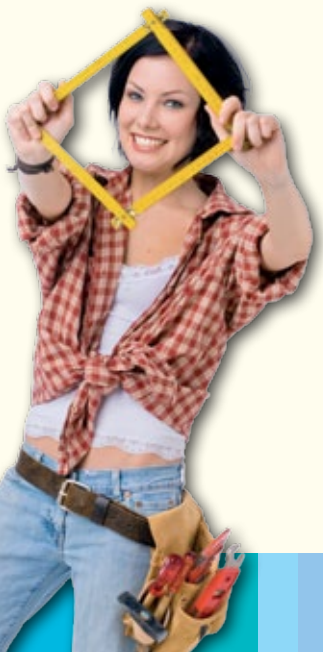
bohl.de 09/2017