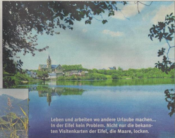
Leben und arbeiten wo andere Urlaube machen... In der Eifel kein Problem. Nicht nur die bekannten Visitenkarten der Eifel, die Maare, locken.

etablierte Qualitätsmarke mit hohem Wiedererkennungsfaktor und offenen, transparenten und modernen Qualitätssystemen. Als Vorreiter des allgemeinen Trends „Rückbesinnung auf die Region“ setzt die Qualitätsmarke auf die ganzheitliche Stärkung der Region Eifel und damit auch ihrer Betriebe. Ein wesentliches Ziel im Interesse der Arbeitgebermarke Eifel ist die Förderung