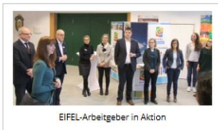
EIFEL-Arbeitgeber in Aktion

Erstmals wurden exklusiv internationale Studierende der Universitäten und Hochschulen in Trier, Luxemburg, Saarbrücken und Metz (QuattroPole-Städte) in die Eifel eingeladen. Der Besuch bei zwei EIFEL-Arbeitgebern – Bitburger Brauerei und Zahnen Technik – erfolgte im Rahmen des Projekts „Campus Meets Company“, in dem das Akademische Auslandsamt der Universität Trier, die Arbeitgebermarke EIFEL und die IHK Trier kooperieren.