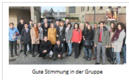
Gute Stimmung in der Gruppe