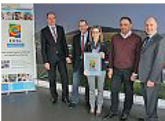
Die Kommunalen Netze Eifel