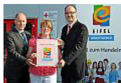
DRK Kreisverband Euskirchen